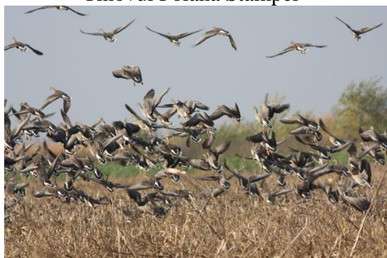
Lacul Iezer Călărași