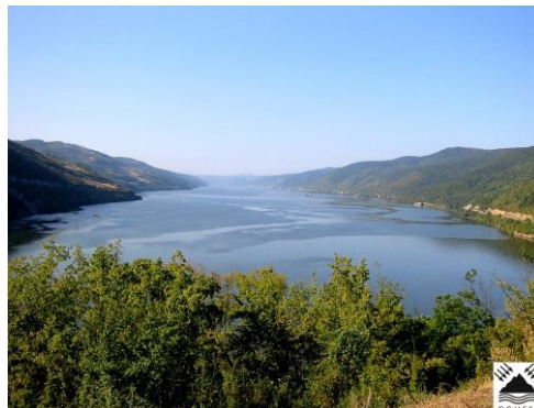
Parcul Natural Porțile de Fier