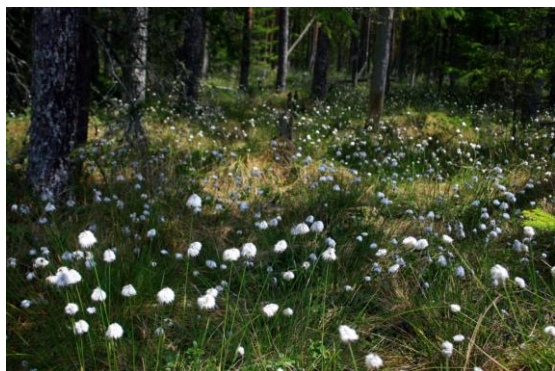
Tinovul Poiana Stampei

De asemenea, în 15 aprilie 2013, miniștrii mediului din România și Bulgaria au semnat un acord de colaborare în urma desemnării transfrontaliere a trei zone comune de-a lungul Dunării: „Iezerul Călărași – Srebarna”, „Suhăia - Insula Belene” și „Bistreț – Insula Ibisha”.