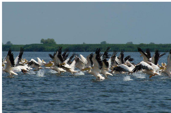
Rezervația Biosferei „Delta Dunării”